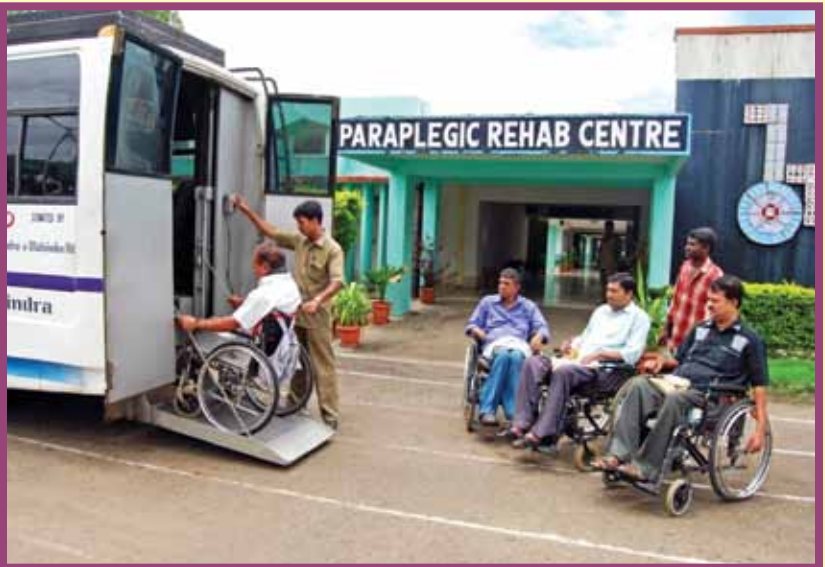
DISABLED SOLDIERS AT A REHABILITATION TRAINING CENTRE