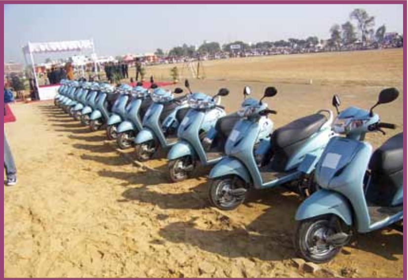
MODIFIED SCOOTERS FOR DISABLED SOLDIERS